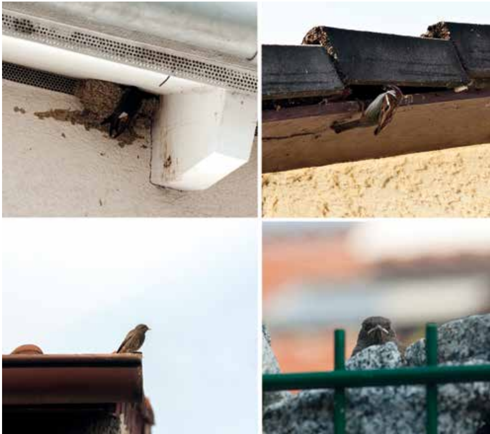
Abb. 1: Oben links: Fütternde Mehlschwalbe in der Pfarrer-Dorn-Straße, Mainz-Marienborn, 16.07.2013. Oben rechts: Typischer Neststandort des Haussperlings unter einem Ortgangziegel, 16.07.2013. Unten links: Weiblicher Hausrotschwanz auf einem Dachfirst in der Anzengasse in Mainz-Bretzenheim, 18.07.2013. Unten rechts: Portrait des Hausrotschwanzes in der Kardinal-von-Galen-Straße in Mainz-Marienborn, 16.07.2013.